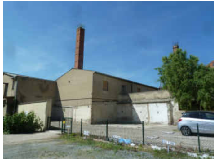
Bild 2: Rückwärtige Erweiterungsbauten aus den 70er-/80er-Jahren, Blick aus Krönchenhagen