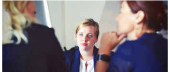
Mit gezielten Fragen können Bewerber im Vorstellungsgespräch ihr Interesse an einem Job untermauern.

in das Unternehmen?" unterstreichen zusätzlich das große Interesse des Bewerbers. Und eine Frage sollten Bewerber am Ende des Gesprächs keinesfalls vergessen: "Wann kann ich damit rechnen, wieder von ihnen zu hören?"